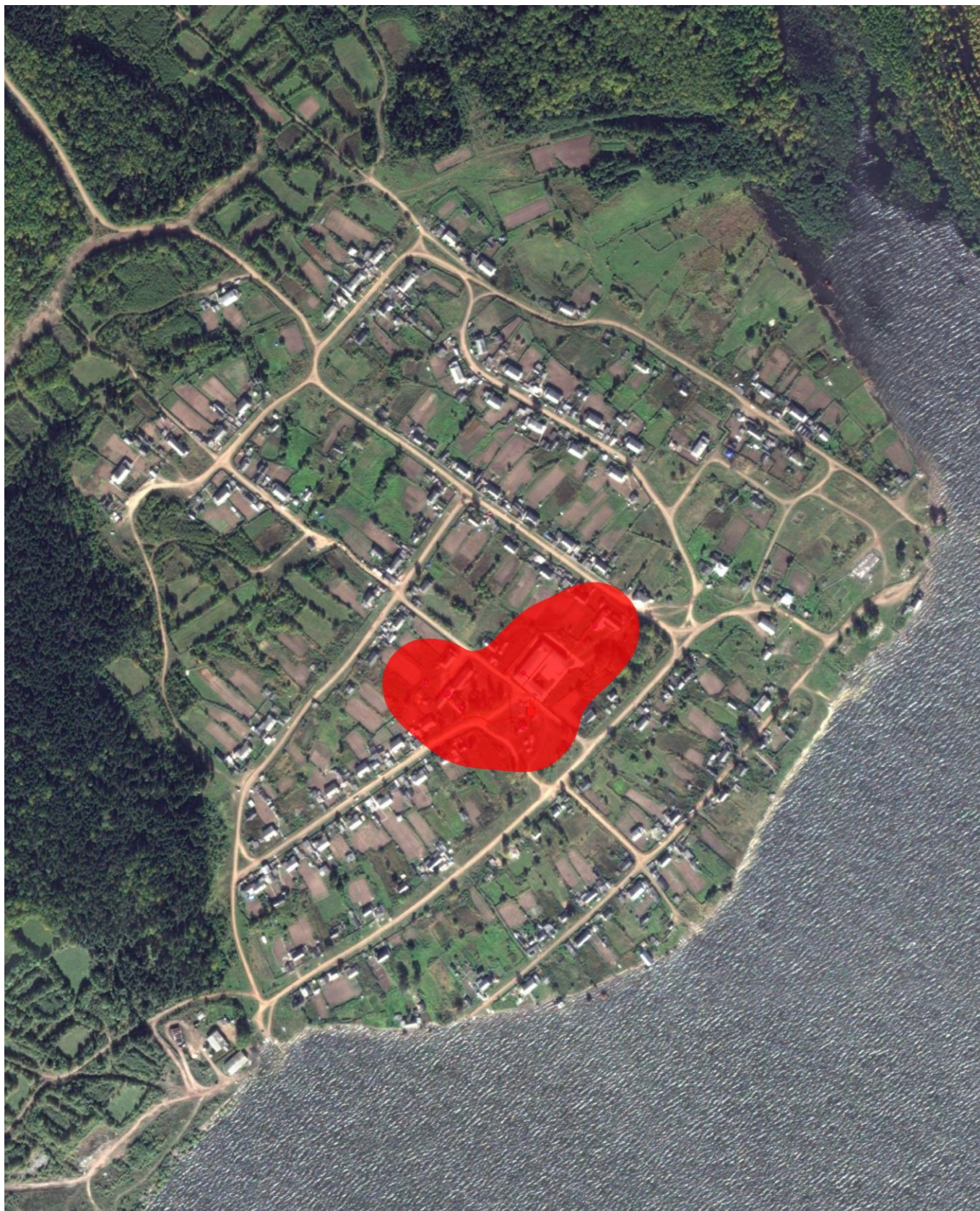
Рис. 2.1 – Зона действия системы теплоснабжения муниципального образования «Санниковское сельское поселение».